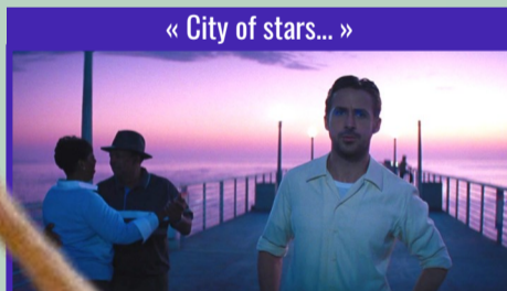
« City of stars... »