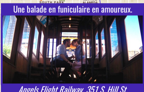
Une balade en funiculaire en amoureux.