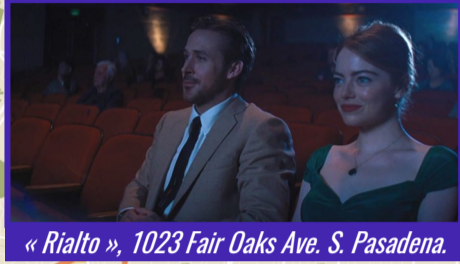
Un ciné devant « La fureur de vivre ».

« Rialto », 1023 Fair Oaks Ave. S. Pasadena.