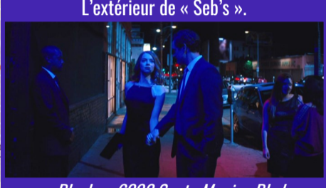
L'extérieur de « Seb's ».