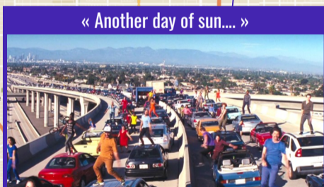
« Another day of sun... »