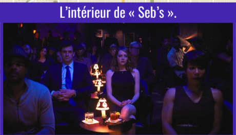
L'intérieur de « Seb's ».

« Blind donkey », 149 Linden Ave., Long Beach.