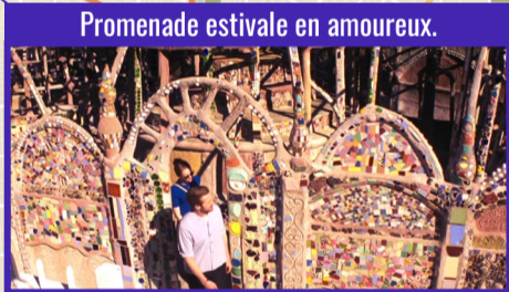
Promenade estivale en amoureux.