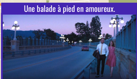
Une balade à pied en amoureux.

Colorado Street Bridge, 504 Colorado Blvd.